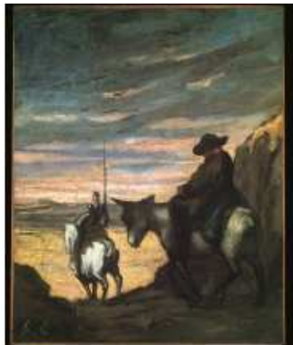
Daumier, Honoré Don Quixote et Sancho Panza (Don Quijote y Sancho Panza) , 1866-1868 Óleo sobre lienzo, 41,3 x 53 cm The Armand Hammer Daumier and Contemporaries Collection. Gift of the Armand and Hammer Foundation. Hammer Museum Los Angeles