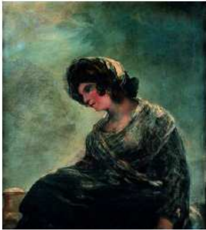
Goya y Lucientes, Francisco La lechera de Burdeos , 1826 ca Óleo sobre lienzo 74 x 68 cm Museo Nacional del Prado Madrid