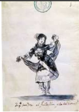
Goya y Lucientes, Francisco A q.e bendra elfaldellin y los calzones? c. 1803-1824 Aguada de tinta china, 20,5 x 14,2 cm Museo Nacional del Prado Madrid