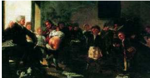
Goya y Lucientes, Francisco La letra con sangre entra 1780-1785 ca Óleo sobre lienzo 19,7 x 38,7 cm Museo de Zaragoza Zaragoza