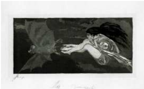
Klinger, Max The witch and the bat , 1881 Aguafuerte 14,3 x 26,8 cm Propiedad del Museo Nacional en Poznan