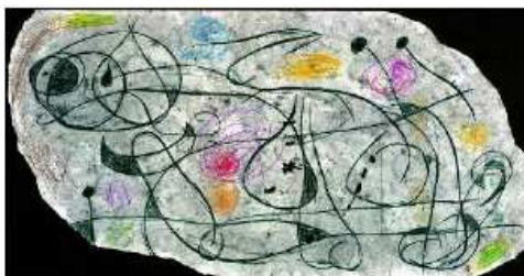
Miró, Joan Personaje aux grosses moustaches , 1975 Gouache, lápiz y ceras 74 x 145 cm Colección A. Surroca Barcelona