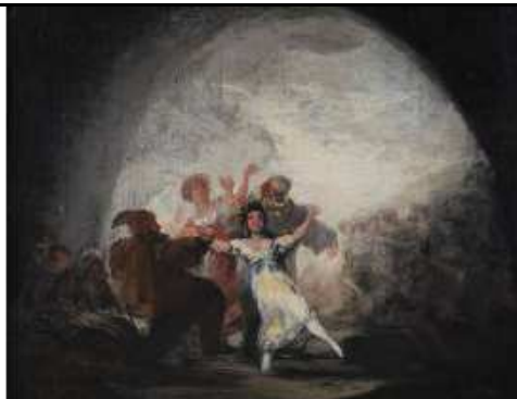
Goya y Lucientes, Francisco Baile de mascarar o Danzantes enmascarados bajo un arco , 1815 Óleo sobre lienzo 30 x 38,5 cm Colección Ibercaja Zaragoza